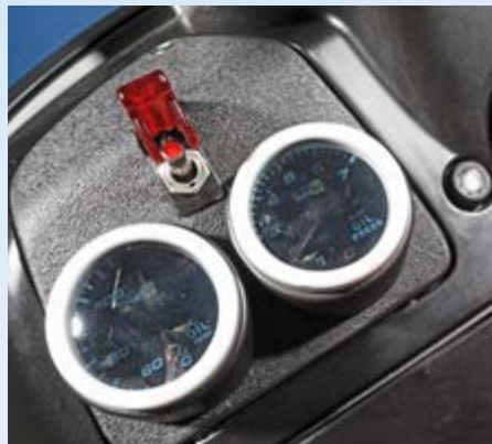
Rotlichbezirk: Der auch haptisch anmachende Kippschalter aktiviert den „Turbo-Boost“ – exklusive Lachgas-Einspritzung