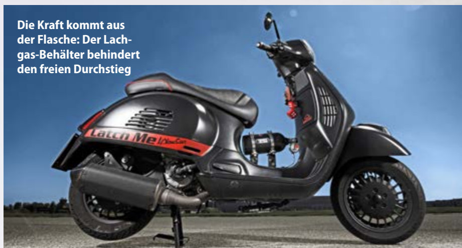
Die Kraft kommt aus der Flasche: Der Lachgas-Behälter behindert den freien Durchstieg

Herrlich leichtfüßig ist das Handling: Im Stadtverkehr fährt der 155-Kilo-Scooter Kreise um die vier Tuning-Motorräder im Schlepptau. Gut haften Michelin City Grip aus serbischer Produktion. Ups, 22000 Euro Kaufpreis sind nur mit Rolleritis im Endstadium erklärbar. Macht vielleicht keinen Sinn. Aber Laune. Sagt ein bekennender Motorradfahrer. Thomas Schmieder