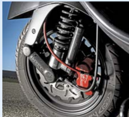
Viel besser als die Serie: Federbein von BGM und Vierkolben-Bremsattel von Spiegler – exklusiv bei Porco Nero Power