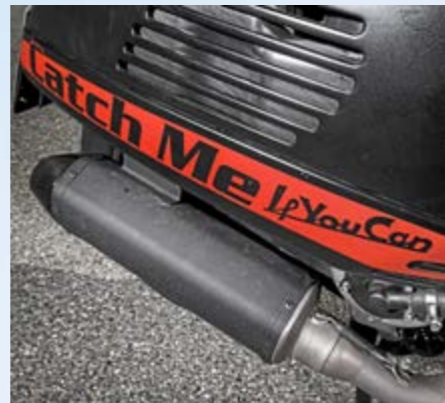
Zur Schau gestelltes Selbstbewusstsein: Diese Wespe sticht! Volltönend-laut klingt der Akrapovic-Auspuff. Wilde Hornisse!